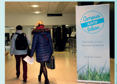
EHESP : signalétique intérieure et extérieure du campus