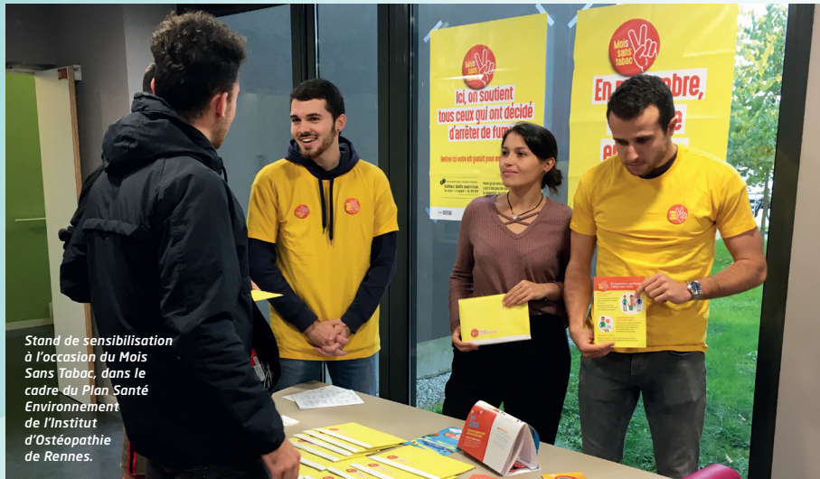
Stand de sensibilisation à l'occasion du Mois Sans Tabac, dans le cadre du Plan Santé Environnement de l'Institut d'Ostéopathie de Rennes.

Assurer un suivi des résultats afin d'identifier les améliorations à apporter.