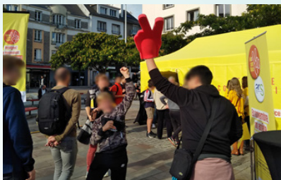
Village #MoisSansTabac de Lorient

Plus de 55 500 Bretons et Bretonnes ont relevé le défi du #MoisSansTabac depuis 2016 !