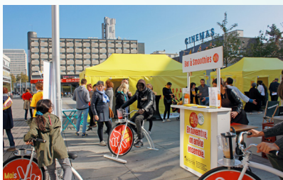
Village #MoisSansTabac de Rennes