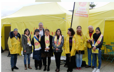
Village #MoisSansTabac de Brest